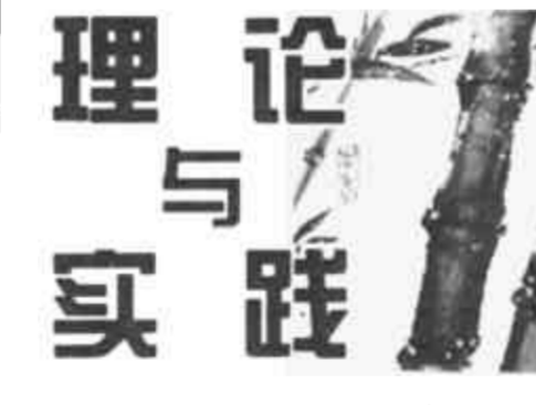
刊头画 延智 本版责任编辑 王海林

我市林业建设立地条件差、起点低，制约和困扰林业发展的因素还不少，但争取林业有一个大发展，从根本上改善区域生态环境的有利条件也很多。 （一）土地资源丰富。我市人均土地6.7亩，居全省之首，宜林面积大，蕴藏着发展林业的巨大潜力；其次，全市现有荒地350万亩之多，占全市总面积的31.6%，并且这部分土地排灌条件都比较好；第三，由于黄河携带泥沙入海沉积造陆，我市土地面积逐年增长，发展林业有着得天独厚的条件。（二）法律保障有力。新的国家《森林法》已于今年4月29日颁布，从7月1日起实施，这对于我们依法兴林、依法治林提供了强有力的法律保障。（三）政治环境优越。党 中央、国务院及省委、省政府、市委、市政府对植树造林，改善生态环境十分重视。去年八月份，江泽民、李鹏等党和国家领导人就生态环境建设问题明确指出“要大力植树造林，绿化荒漠，实现山川秀美”。党的十五大提出将进一步大力植树造林，改善生态环境，实现可持续发展作为基本国策；省委、省政府在1991年4月作出了《学习广东，奋战十年，绿化山东的决定》，去年12月又制定出台了《加强水土综合治理，建设生态农业的决定》，并对今后一个时期造林绿化的任务目标、工作重点和政策措施进行了全面部署；市委、市政府对造林绿化工作也十分重视，于1991年5月作出了《苦战十年，绿化东营 的决定》，近几年又将林业作为全市实施农业产业化的主导产业，市领导经常亲临林业生产一线检查指导工作。所有这些，形成了我市发展林业的优越的政治环境。（四）物质基础雄厚。国家经济持续、稳定、健康发展，为林业生产建设奠定了雄厚的物质基础。发展林业，一靠政策，二靠投入，三靠科技。林业作为一项社会公益事业，只有在保证投入的基础上，才能实现快速发展。（五）产业基础坚实。上一届林业局领导班子在市委、市政府的正确领导下，艰苦创业，无私奉献，积极主动地开展各项工作，林业生产建设取得长足发展，为今后林业发展打下了坚实的基础。（六）方向目标明确。《东营市林业